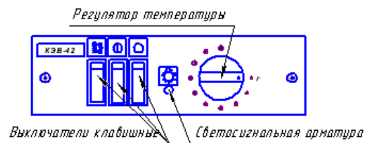
Рис. 1 Панель управления

7.1. Эксплуатация калорифера должна осуществляться в диапазоне рабочих температур от -10°C до +40°C согласно требований “Правил технической эксплуатации электроустановок потребителей” и “Правил техники безопасности при эксплуатации электроустановок потребителей” (ПТЭ и ПТБ).